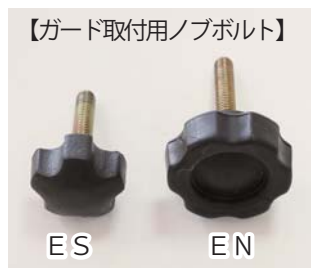
【ガード取付用ノブボルト】